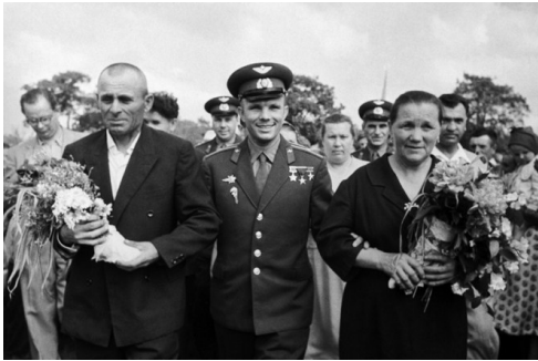
Юрий Гагарин с родителями